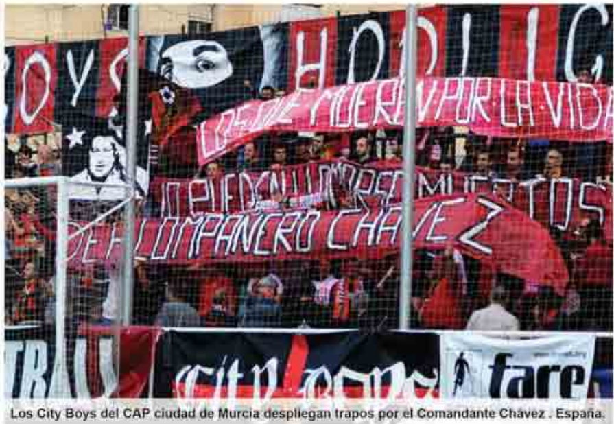
Los City Boys del CAP ciudad de Murcia despliegan trapos por el Comandante Chávez . España.