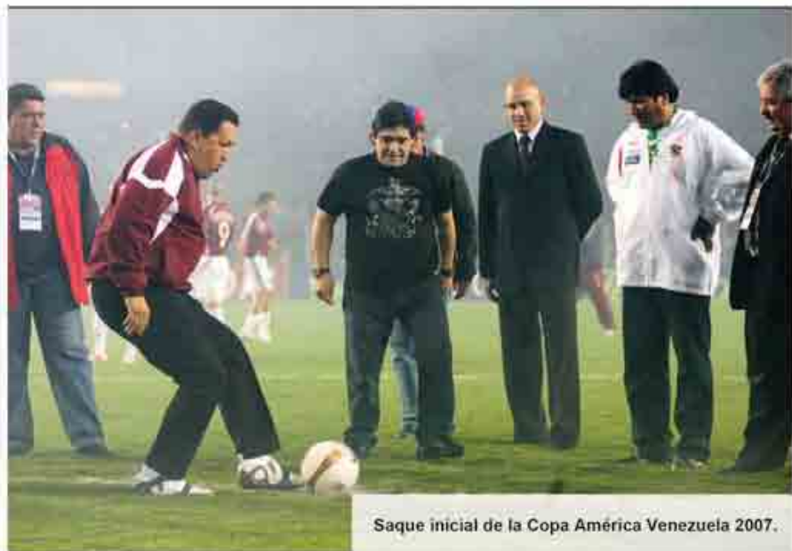
Saque inicial de la Copa América Venezuela 2007.