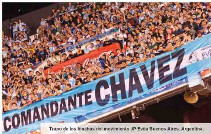
Trapo de los hinchas del movimiento JP Evita Buenos Aires. Argentina.