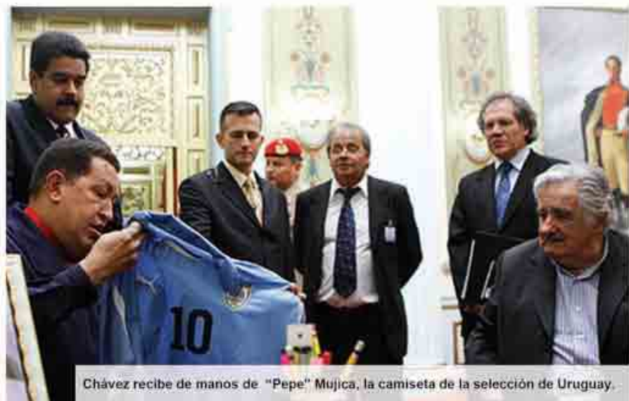
Chávez recibe de manos de "Pepe" Mujica, la camiseta de la selección de Uruguay.