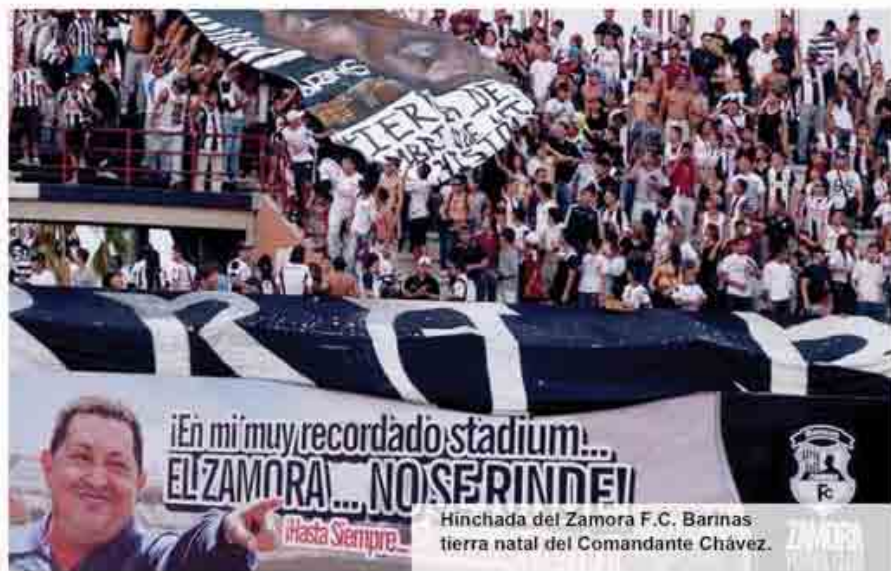
Hinchada del Zamora F.C. Barinas tierra natal del Comandante Chávez.