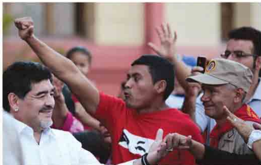
Maradona saluda al pueblo venezolano durante una visita al Cuartel de La Montaña.