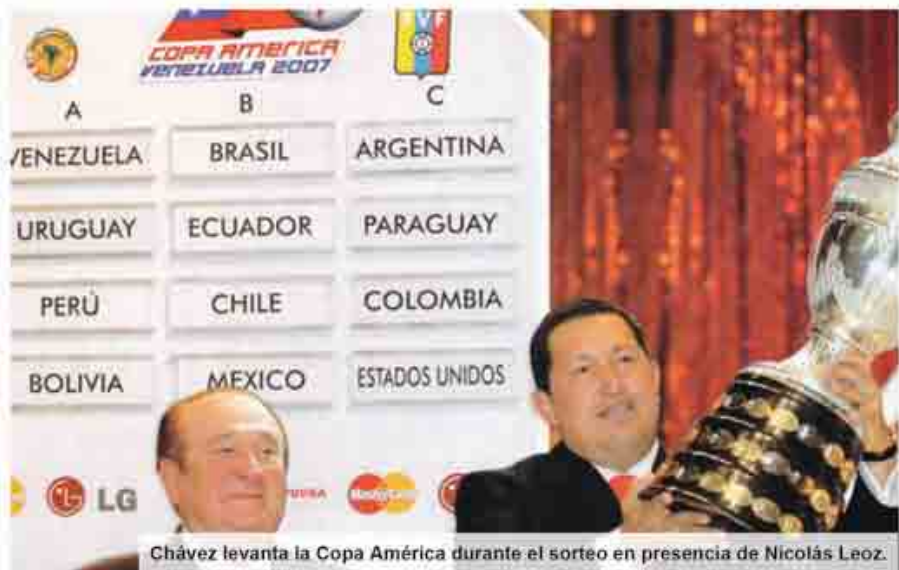
Chávez levanta la Copa América durante el sorteo en presencia de Nicolás Leoz.